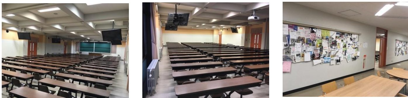
図4 椅子固定教室ブロック その1（E310）の内観及び外観