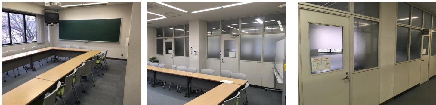
図3 N棟演習室ブロック（N234）の内観及び外観