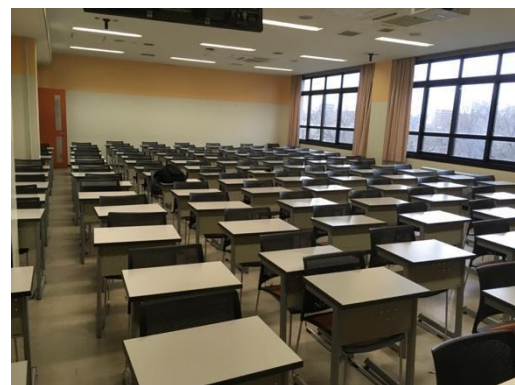
図2 大教室ブロック（E308）の内観